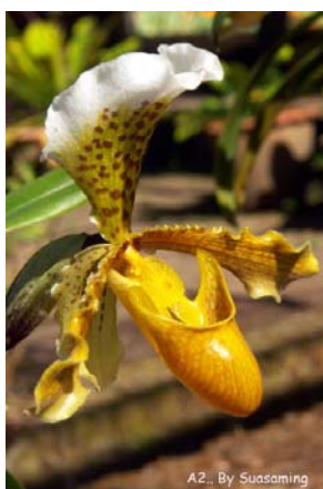
ภาพที่ 5. กล้วยไม้รองเท้านารี

ออกดอกสีชมพูสวยไม่น้อยกว่าดอกไม้อื่นๆ บางต้นก็เริ่มติดผลอ่อนเล็กๆ ให้เห็นบ้างแล้ว เพลินชมธรรมชาติสวยงามหลากหลายมุมมองในศูนย์วิจัยฯ อย่างไม่รู้เบื่อ นอกจากนี้มีมุมมองที่เห็นคอยหลวงเชิงดาวอย่างเต็มตาได้ดีที่สุดแล้ว ที่นี่ยังเป็นจุดชมพระอาทิตย์ขึ้น- ตกที่สวยงามแปลกตาไม่ซ้ำที่ไหนๆ และยังมีจุดชมทะเลหมอกยามเช้าที่ดีมากอีกแห่ง (ภาพที่ 7) เป็นการเดินทางมาเยือนที่คุ้มค่ายิ่งนัก ระยะเวลาที่ไม่ไกลนักแต่สวยงามมากด้วยธรรมชาติหลากหลายสีสรรค์ นี่จึงเป็นอีกหนึ่งความประทับใจไม่รู้เบื่อ หากจะเลือกมาพักผ่อนในช่วงวันที่สับสนเพื่อหลีกเลี่ยงผู้คน หรือในวันพักผ่อนสบายๆ ได้สวนเสเฮฮา กับเพื่อนสนิทมิตรสหาย และแสนโรแมนติกเมื่อยามได้มากับคนรู้ใจ หากคุณมีโอกาสได้มาเยือนคงไม่พลาดที่จะกลับมาเยือนอีกครั้งอย่างแน่นอน