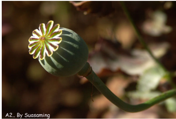
ภาพที่ 3. ดอกและผลฝิ่น