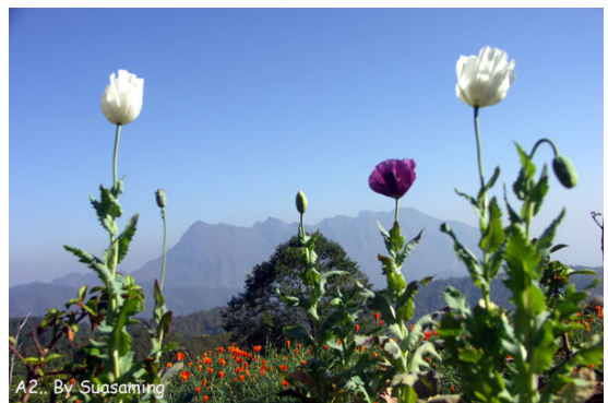
ภาพที่ 1. แปลงดอกฝิ่นจากหลังเป็นยอดคอยหลวงเชิงดาว