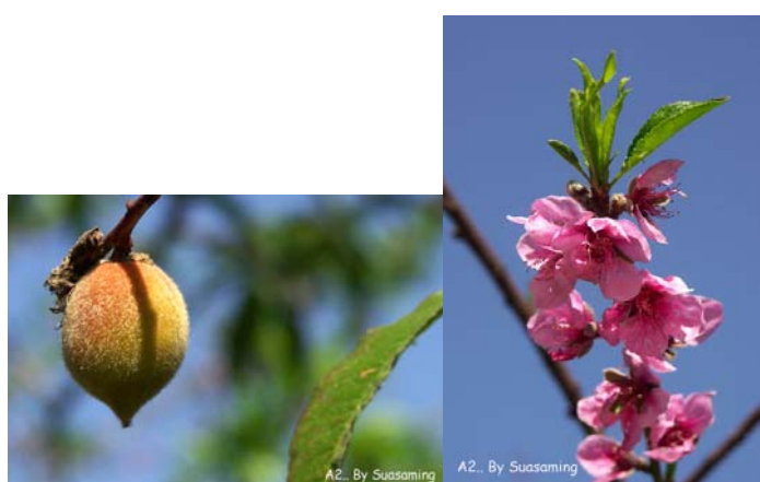
ภาพที่ 6. ผลและดอกท้อ