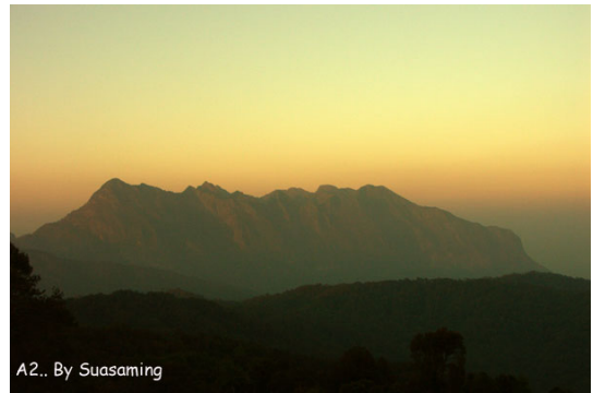
ภาพที่ 2. ทิวทัศน์ของคอกยหลวงเชียงดาว

หลงเพลินชมภาพความงามที่ธรรมชาติ วิจิตรบรรจงสร้างไว้อยู่เป็นนาน แต่อย่างไรก็ไม่ ลืมความตั้งใจที่จะได้มาเห็นดอกฝิ่นที่ปลูกไว้ใน แปลงทดลอง สอบถามทางเจ้าหน้าที่ซึ่งได้รับ คำแนะนำด้วยอัธยาศัยอันดียิ่ง เจ้าหน้าที่บอกว่า คณะของพวกเรา มาช้าไปหน่อยดอกฝิ่นเริ่มโรย กลายเป็นฝักไปแล้วเสียส่วนใหญ่ แต่ก็ยังมี ให้เห็นบ้างไม่มากนัก จะมากหรือน้อยไม่เป็นไร ขอเพียงได้ชื่นชมบ้างก็อิมเอมใจแล้ว ดอกฝิ่น ดอกเล็กๆ สีขาวและสีม่วงเข้ม (ภาพที่ 3) อวด ดอกตั้งตรงแทรกตัวอยู่ท่ามกลางแปลงดอกปอปปี้ สีส้มสด ที่ดูจะโดดเด่นไม่น้อย หากความหวัง พวกเราไม่ดิ่งไว้ที่ดอกฝิ่น คงตื่นตาไปกับเจ้าดอก ปอปปี้สีส้มบาดตา(ภาพที่ 4) ที่ปลูกไว้มากมาย ทั่วอาณาบริเวณตลอดเนินเขาลาดระดับกันไป