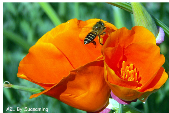
ภาพที่ 4. ดอกปอปปี้