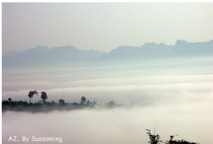
ภาพที่ 7. พระอาทิตย์ตกดินและทะเลหมอกที่คอยหลวงเชียงดาว