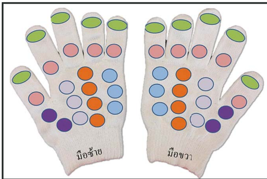
ภาพที่ 1 ตำแหน่งจุดติดลูกปัด 22 จุดของนวัตกรรมถุงมือลดอาการชาสำหรับผู้ป่วยเบาหวาน

สัปดาห์ที่ 4 ตรวจวัดอาการชามือ กับกลุ่มตัวอย่างที่ได้ใช้นวัตกรรมถุงมือเพื่อ ลดอาการชาสำหรับผู้ป่วยเบาหวานมาแล้ว 4 สัปดาห์ โดยพยาบาลวิชาชีพชำนาญการ เป็นผู้ทำการวัดและทำการบันทึกผล และ กลุ่มตัวอย่างประเมินความพึงพอใจต่อการ ใช้นวัตกรรมถุงมือเพื่อลดอาการชาผู้ ป่วยเบาหวาน โดยใช้แบบสอบถามวัดระดับ ความพึงพอใจต่อการใช้นวัตกรรม