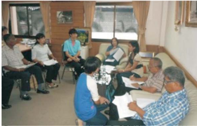
ภาพที่ 1 การประสานงานกับองค์การบริหารส่วนตำบลพลูตาหลวงและผู้นำชุมชน

จากการประสานขอความร่วมมือกับองค์การบริหารส่วนตำบลพลูตาหลวง และผู้นำชุมชน (ดังภาพที่ 1) เพื่อเข้าไปเก็บข้อมูลตามเส้นทางท่องเที่ยว (ดังภาพที่ 2)